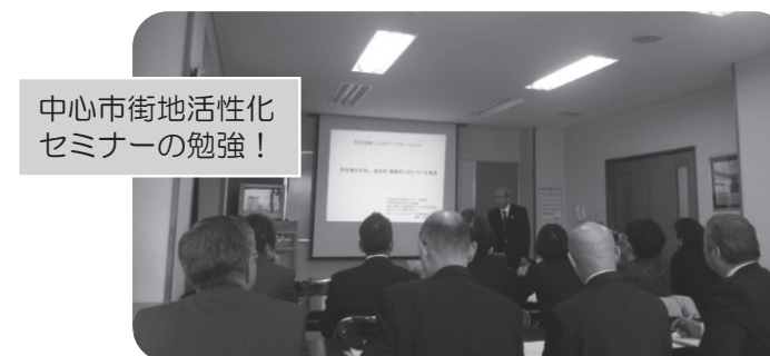
中心市街地活性化 セミナーの勉強!