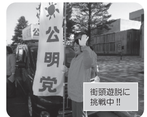
街頭遊説に 挑戦中!!