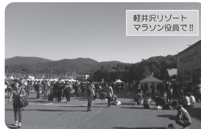
軽井沢リゾート マラソン役員で!!