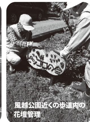
風越公園近くの歩道内の花壇管理