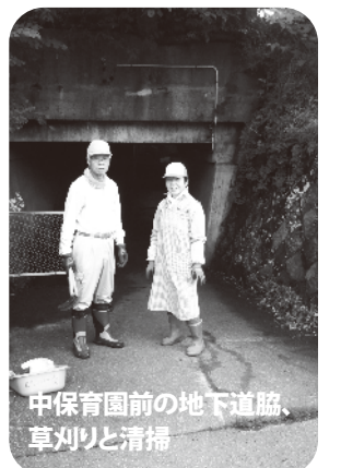
中保育園前の地下道脇、草刈りと清掃