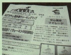
安心健幸マイレージ パンフレット