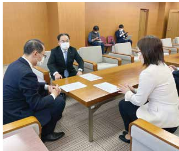
▶ 所属する会派のメンバーとともに山野市長(左)に 女性の負担軽減を要望しました=金沢市役所

コロナ禍における女性の負担軽減に関する緊急要望を、所属する公明党金沢市議員会の一員として山野市長に伝えました。コロナ禍の中、職を失ったり休業を余儀なくされる女性が増えており、「迅速かつ手厚い支援を行っていく必要がある」と訴えました。要望では、雇用環境の悪化をはじめ、DV(配偶者などからの暴力)や緊急事態宣言を受けた休校・休園による家事・育児の負担増といった問題を踏まえ、就労支援や相談体制の強化なども求めました。