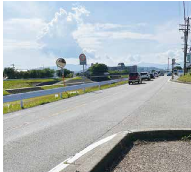
▶ 道路沿いに設置された転落防止用 ガードレール(写真左側)=金沢市諸江町中丁