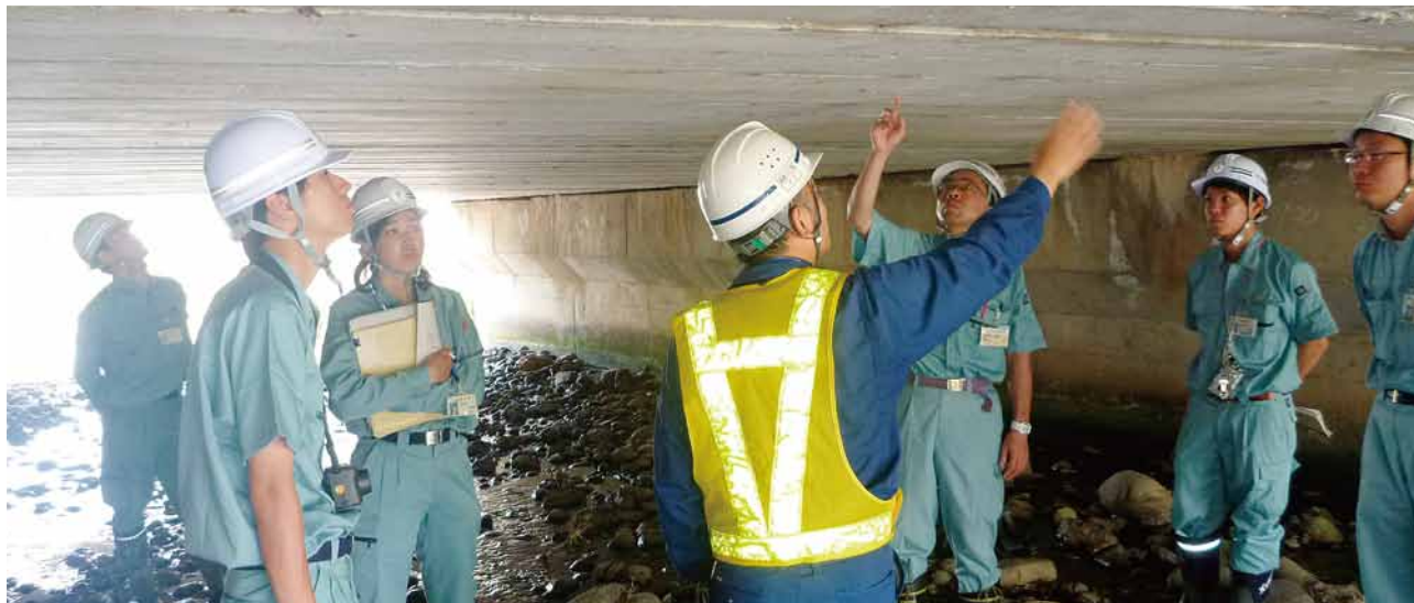
金沢市が実施する橋りょう点検

長さ15メートル以上の橋232か所については、平成24年度中にすべて点検を行い、長寿命化計画を策定する予定である。財源の確保については、橋の更新等のための事業費を中期財政計画に盛り込むほか、寿命を延ばすための計画に基づき、国庫補助金が引き続き確保される見込みである。今後とも計画的な更新を心がけたい。