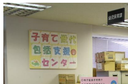
【子育て世代包括支援センターの設置】

※安心して妊娠、出産、子育てができる切れ目のない支援の充実を図るため、総合福祉保健センター2階に平成30年4月設置