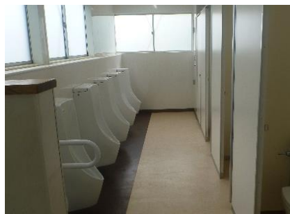
【小中学校トイレの洋式化】

※トイレの内装、床の乾式化、便器の洋式化を推進し、平成30年度までにすべての小学校のトイレ洋式化整備に着手。中学校は、内装や乾式化に向けた整備を推進。（避難所として利用時には高齢者にも安心）