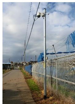
【子ども見守りカメラの設置】