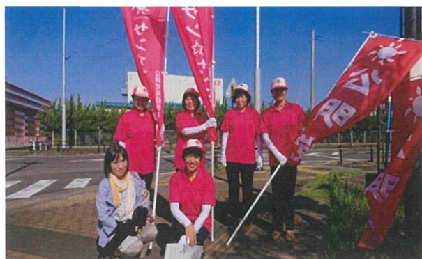
H30.9.19 島原半島でサンサン遊脱活動（長崎県本部女性局の皆さんと）