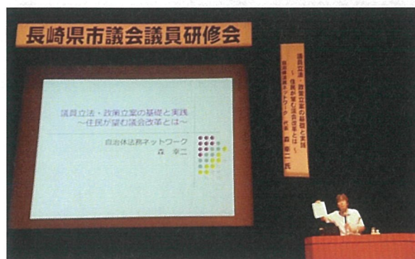
H30.8.23 長崎県市議会議員研修会