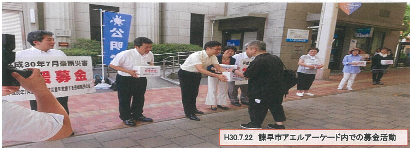
H30.7.22 諫早市アエルアーケード内での募金活動