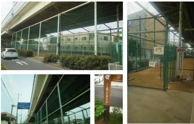
西一之江こども野球場

現状の市有地(市が所有して利用されていない土地)を公園として活用できないか 質問したところ、【市有地の公園活用は、これまで市街地再整備のために取得した土地を、暫定的に公園として整備するほか、既存公園に隣接している市有地を利用し、公園拡張整備を行っている。 市としては今後も市有地の有効利用の中で、公園としての利用も検討していく考え 】との回答がありました。