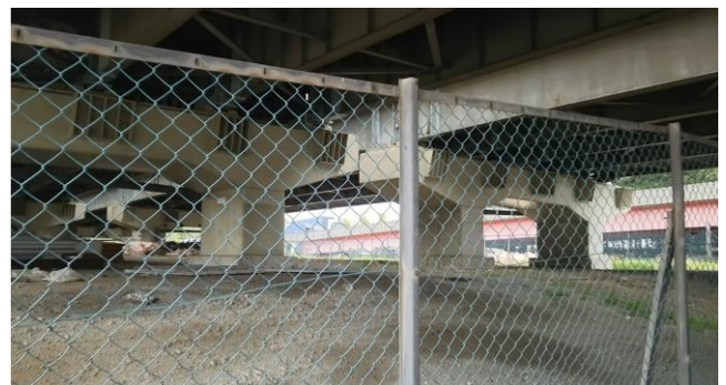
首都高速 <富岡 - 東野 高架下>

そこで、東京都江戸川区の西一之江こども野球場のように、京葉道路の下の空間と土地を活用し、子どもたちのボール遊び場として提供している例をあげ、浦安市を通る首都高速湾岸線・国道357号線の富岡・東野付近の高架下スペースを活用して、ボール遊び場の整備を提案したところ【 首都高速湾岸線の高架下については、ボール遊び場としての利用の可能性について、関係機関と協議・検討したい 】と前向きな回答があり、今後もボール遊び場の推進をして参ります！