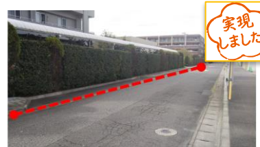
国道357号下り線 浦安市東野1-27-1 カーサセントリア 付近

集合住宅カーサ・セントリアマンション理事会様より取り締まりの強化を要望され、公明党市議と公明党赤間県議が連携して対策に動き、今後は浦安警察署が標識を増設し、駐車違反車両への取り締まりを強化する運びとなりました！