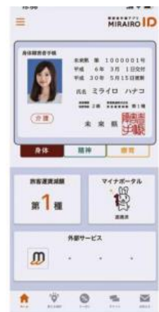
ミライロIDのスマホ画面イメージ

そこで、浦安市でも公共施設や公共交通機関などへミライロIDの推進について質問したところ、福祉部長から「本市では障がい者手帳をお持ちの方に対し、ミライロIDの周知を図っており、今後は、ミライロIDが利用できる公共施設や交通機関などの拡大が図られるよう、関係部署と連携して取り組んでまいります」との前向きな答弁がありました。