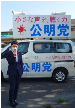
7月22日 東野交差点で御礼街頭

コロナ禍が長期化する中で、带状疱疹を発症する高齢者が増えてきており、今回の参院選で再選させて頂いた浦安市民の竹内しんじ参議院議員も、そのお声から3月の国会質問で公費助成を訴え、前向きな答弁を引き出しました。