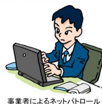
事業者によるネットパトロール

子どもたちのネット依存、スマホ依存やネットいじめ等の問題を調査し、対策を議会で提案してきました。令和元年9月議会では市独自のネットパトロールを提案した結果、令和2年7月より運用開始。青少年のネット問題を、より現場に近いところで対応する仕組みが教育委員会に作られました。