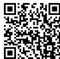
浦安市のネットパトロール導入までの経緯