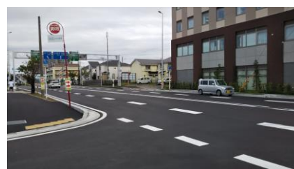
幹線5号浦安中央病院前付近