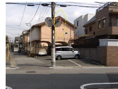
堀江2丁目ポルトベネーレ跡地 十字路にカーブミラーを増設