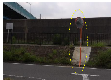
富士見3丁目旧江戸川沿い 堀江橋下にカーブミラーを新規設置