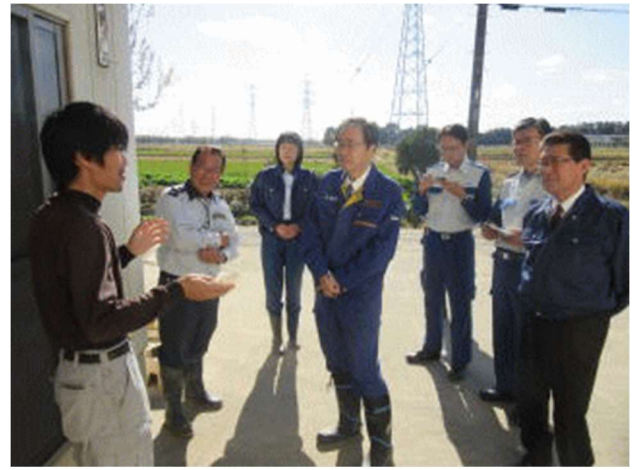
公明党 齊藤幹事長 深谷県議 森田市長