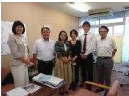
レインボーさいたまの会の皆さんと

6月議会で、私が紹介議員となった「東松山市におけるパートナーシップの認証および性的少数者に関する諸問題への取組に関する請願」 が採択されました。