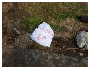
塩カル・砂散布と砂袋