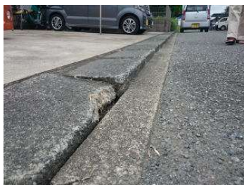
(破損した蓋の一部)