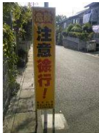
交差点の手前に設置