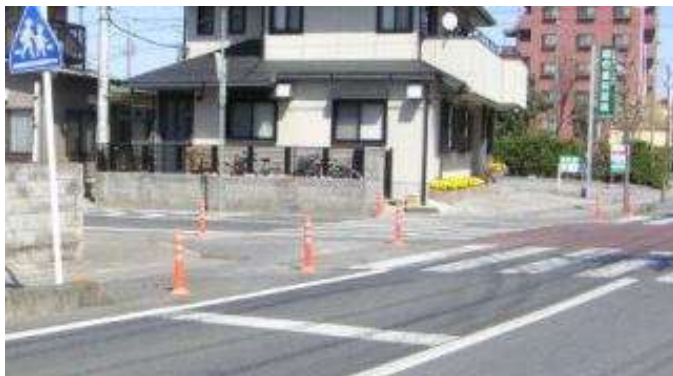
歩行者の溜りを広く取り、巻き込み防止のポールを敷設