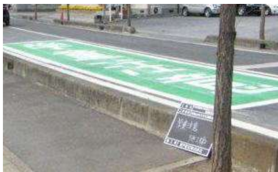
路面表示 2 種類