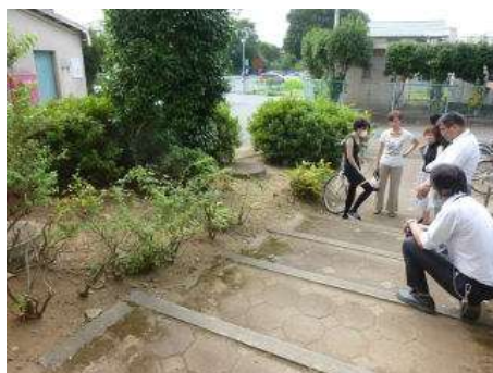
（公社職員に団地自治会長、住民の方の立会で現状を訴える）