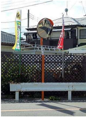
（増設前：右方向のみ）

松山町地内で、既に設置されていたミラー。設置当初は片方向だけでよかったのですが、宅地の造成により交差点の見通しが悪くなってしまうとの地域住民の方の指摘を受け地元自治会から設置申請を市に提出ねがい設置されました。