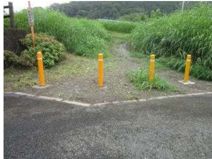
(2枚とも完了の写真)