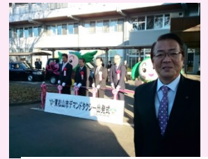
H27年 デマンド 出発式