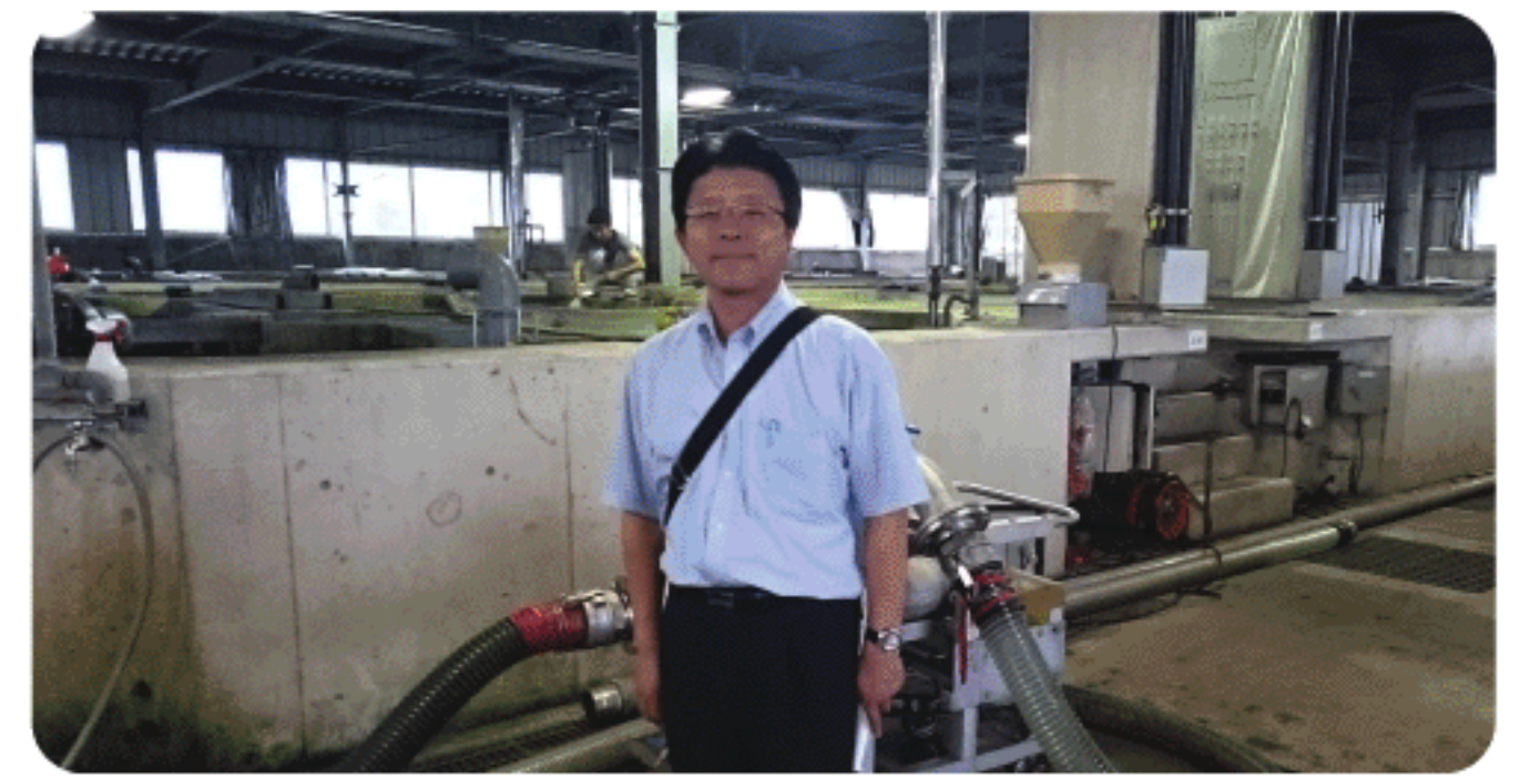
鮎の魚苗センター