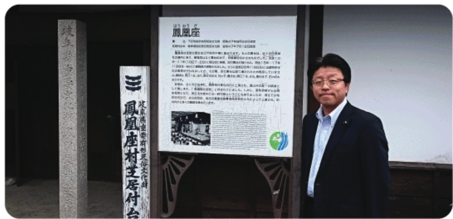
重要有形民俗文化財「鳳凰座」