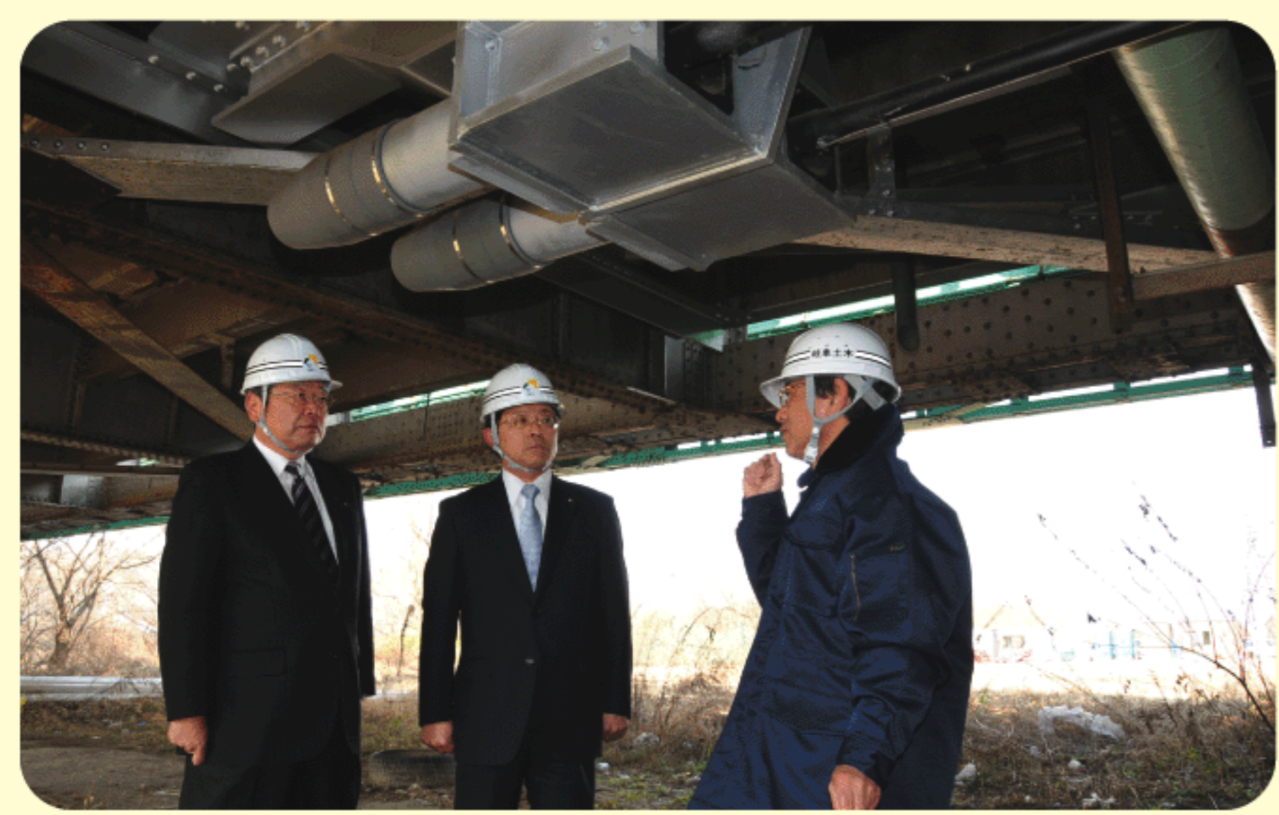
2013年2月22日 県管理のトンネル、道路橋、河川構造物の点検現場を視察