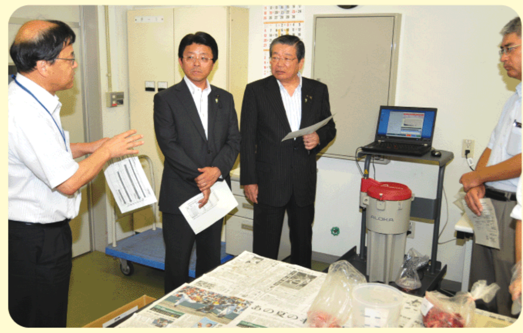
2011年9月8日 県公衆衛生検査センターにて、県内産牛肉の全頭検査を視察