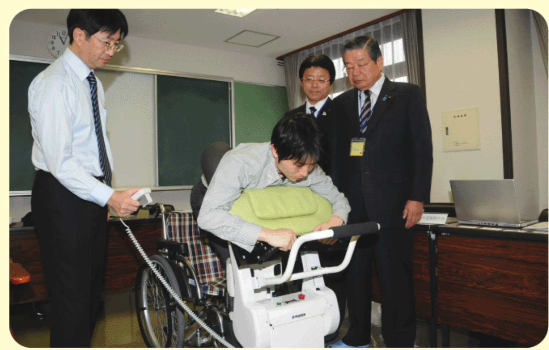
2014年2月3日 介護ロボット導入へ モニター調査を視察

2014年8月21日 企業との共同研究など 産官学連携活動拠点である、 ぎふ技術革新センターを視察