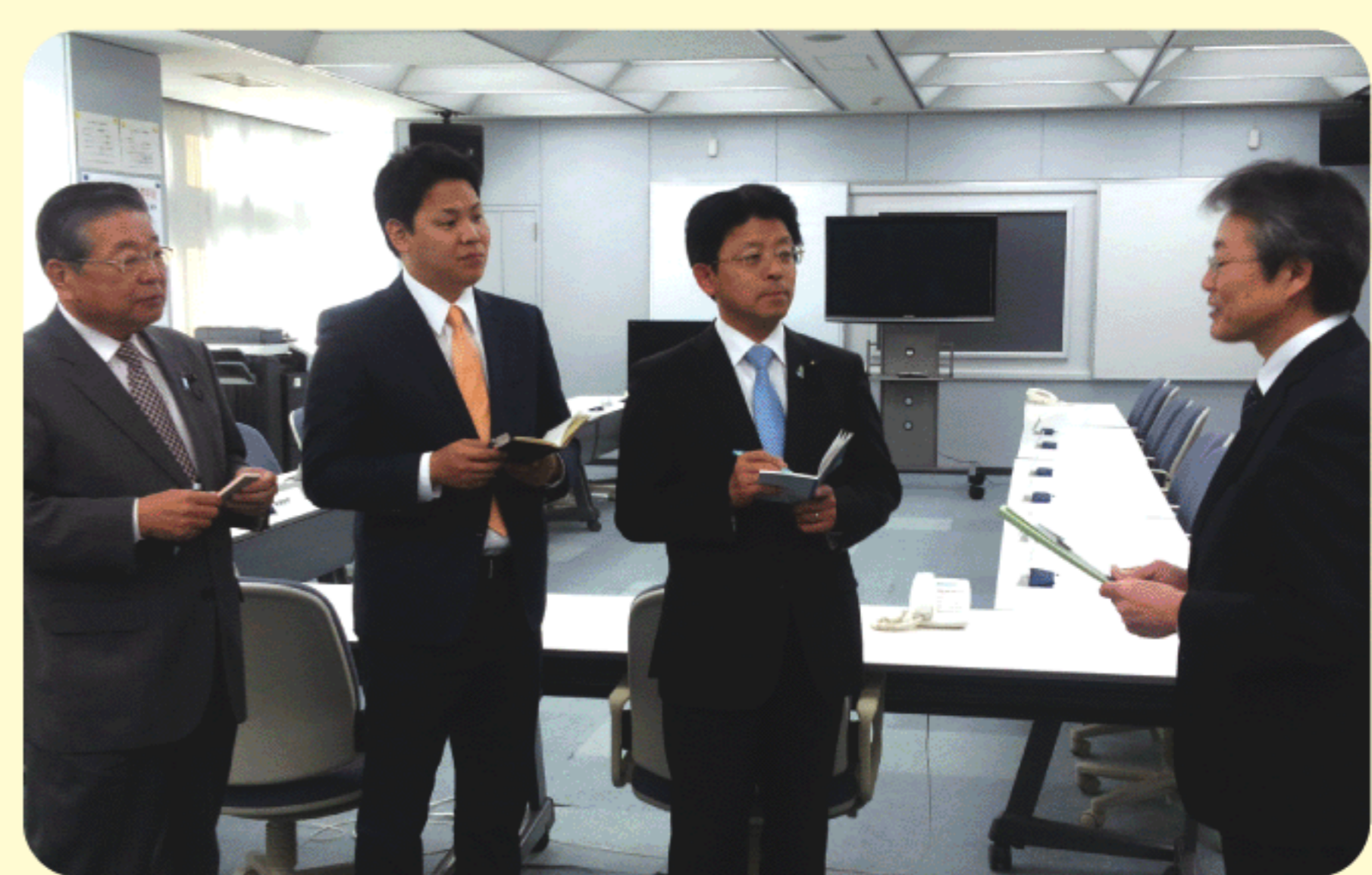
2014年11月13日 岐阜県防災交流センター視察 県庁が被災して十分な情報収集や対応ができなくなった場合の施設