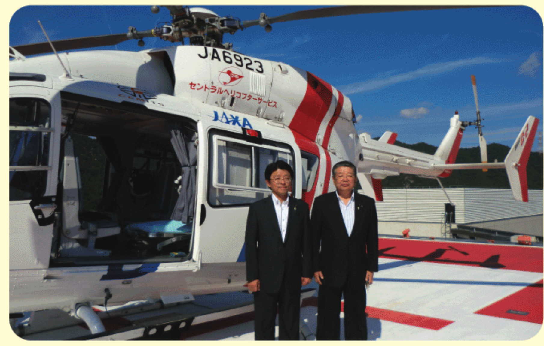
2011年9月13日 岐阜大学付属病院のドクターヘリを視察