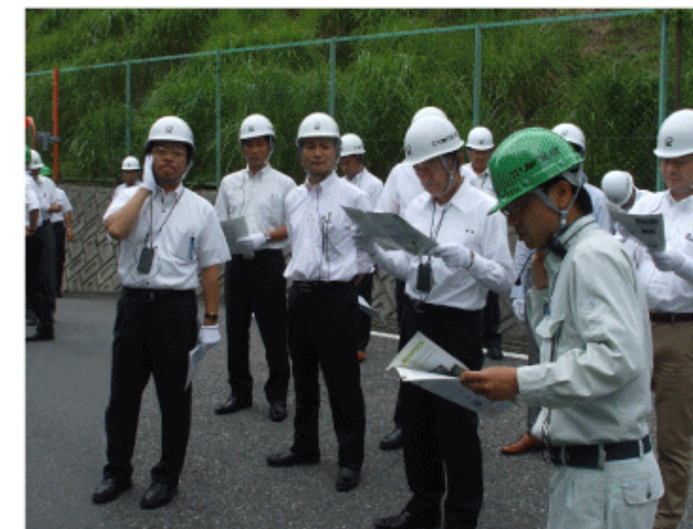
担当者から説明を聞く

(株)りゅういき上石津工場では、県各務原浄化センター及び近隣市町村から運ばれてくる、下水道汚泥を使って、高品質の地盤安定材などの原料や、バイオマス燃料を製造しており、下水道汚泥の完全リサイクル化を実現している。