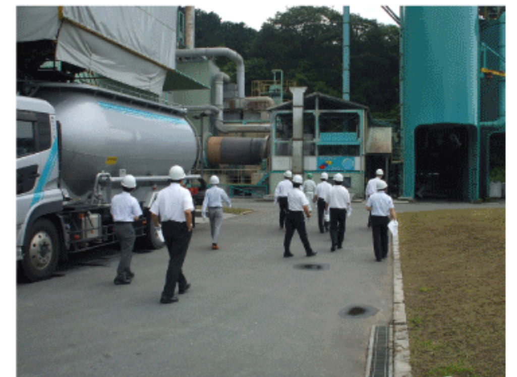
下水道汚泥リサイクル工場