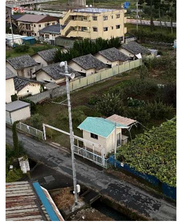
石和町川中島地内高層マンション付近に設置された防災行政無線(子局)

私は、市が本年3月から10年計画で策定した防災行政無線の長寿命化計画のうち、特に石和・春日居地区の市街地において高層マンションなどで拡声音量に対する苦情や約270基ある無線機の維持管理に対する市民相談を受け、費用対効果を確認する中、今後の維持管理費削減に繋がる新システム導入を求め市の取り組みを伺いました。