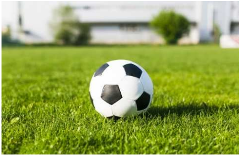
学校・公園の芝生グラウンドなどを活用した雨水貯留浸透機能の施設整備が望まれる

私は、国が強力に進める「防災・減災・国土強靱化」「地域振興・地方創生」「生態系・環境保全」など3つの要素を融合させるグリーンインフラ整備事業が①地球温暖化の緩和や浸水対策、②生き物の生息・生育空間の提供など環境への効果が期待できることから、先進自治体の事例を参考に早期実現を求めて市の取り組みを伺いました。