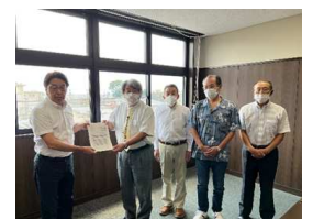
6月19日 要望書を提出 12月26日 市から経過報告

平成16年3月に山梨県と市部まちづくり倶楽部間で締結された市部通り街路灯に関する維持管理協定書について昨年6月19日に市部3区、市部まちづくり倶楽部、沿線住民の各代表者とともに山下市長に対して市に維持管理を求める要望書を提出したところ、昨年12月13日に県と市が協定書を締結し令和6年度事業計画が実現しました。