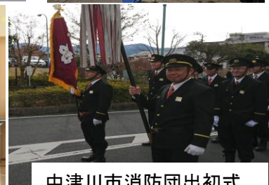
中津川市消防団出初式