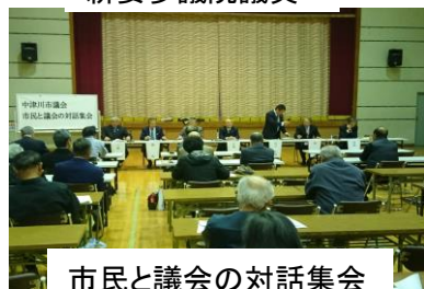
市民と議会の対話集会