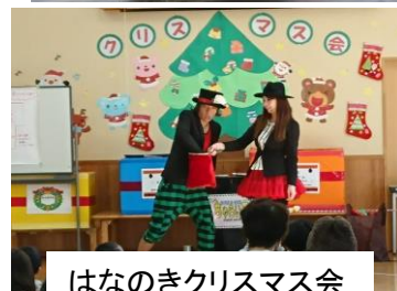
はなのきクリスマス会