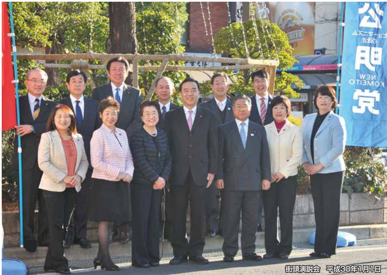
街頭演説会 平成30年1月1日

江戸川区議会公明党は、1月1日にJR小岩駅南口にて新春街頭演説会を行い、13名全員で決意も新たに本年をスタートしました。区民のお声をしっかりと受け止めて、生活者の目線から政策を実現し、笑顔があふれる安全・安心のまちづくりに全力で取り組んでまいります。