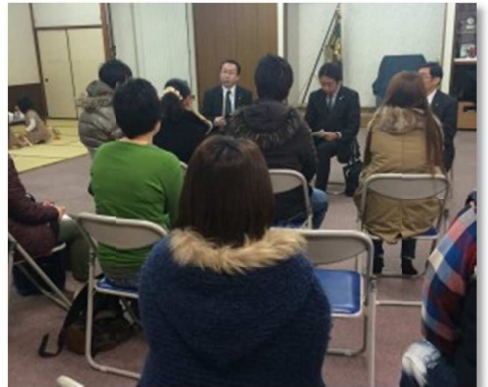
緊急に懇談会を開催