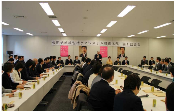
衆院第2議員会館で厚生労働省交えての初会合

公明党の地域包括ケアシステム推進本部は初会合を開き、「地域包括ケアシステム」の構築に向け、全力で取り組んでいくことを確認した。これには全国から地方議員も参加し、活発に意見交換も行われた。