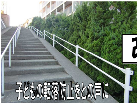
溝沼6交差点付近 柵改善