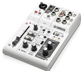
例：オーディオインターフェイス

質 コロナ下で音楽家、芸術家の方々、その舞台等を支える音響や設備に関わる裏方さん達は相当打撃を強いられています。音楽をやっている方の中には、オンライン配信で工夫しながらライブを行っている方がいますが、使用する機材をすべて個人で揃えるのは負担となります。ホール等でオーディオインターフェイスなど機材の貸し出すことはできないか。どのような支援ができるか伺います。