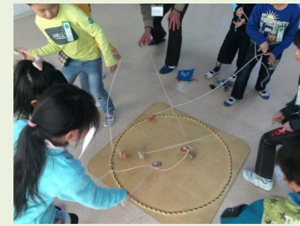
小学校で昔遊びを町内会の方と