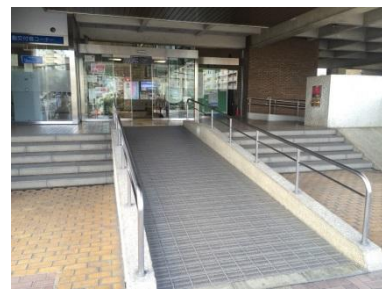
朝霞市役所 正面入り口

朝霞市役所正面入り口のスロープを改善障がいを持つ方から、杖が引っ掛かる、滑りやすい等の声をいただき、訴えていました。この度予算が確保でき、今後どのように改善したら良いのかご意見をいただきながら形としてまいります。(28年度中工事)