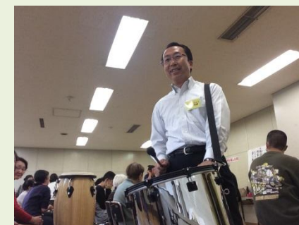
療育音楽を楽しむ会(メイあさかセンター)