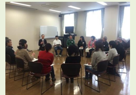
ボランティアバス参加者の集い