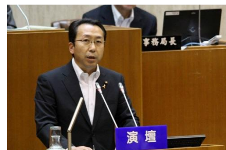
写真は昨年のもです