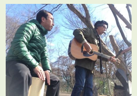
即席バンド「おじーズ」でカホンを