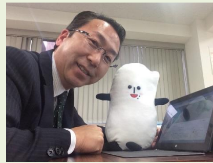
IT講習会で「コメ助」と