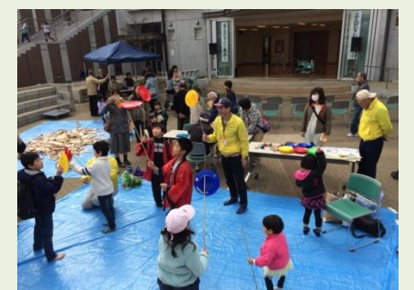
ひざおりまつりで賑やかに