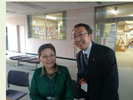
介護の日イベント運営スタッフに