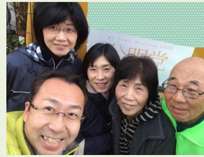
地域回りで笑顔のあいさつ