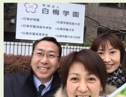
子ども食堂の準備で教授と懇談