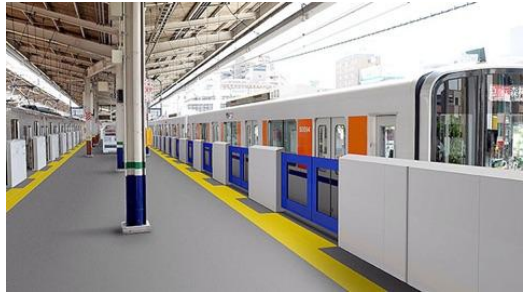
和光駅のホームドアイメージ

2020年東京五輪・パラリンピックの会場のひとつとしての朝霞。これを機に開催までに、東上線朝霞駅にホームドアを設置していきたいとの答弁がありました！粘り強く訴えてきたことがついに実現！みなさまの強い要望の声が形となります。