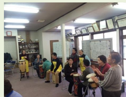
うらの会で楽器を準備