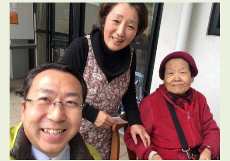
膝折団地ふれあい広場にて