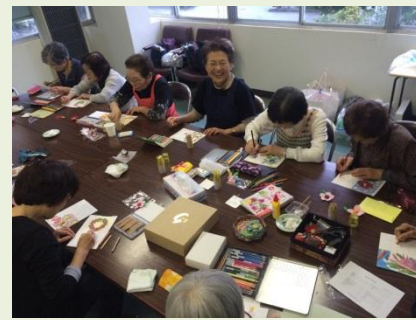
あさがおの会で楽しく一緒に活動