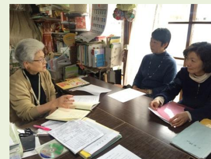
絵本で世代間交流をと懇談