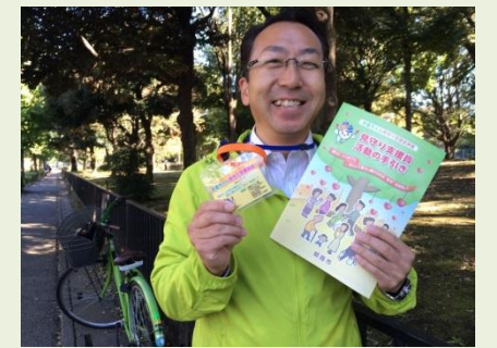
彩夏ちゃん見守り支援員に登録