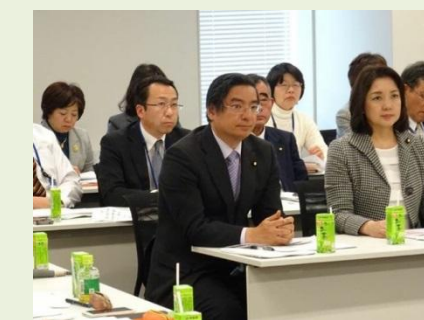
地域包括ケアシステム党学習会