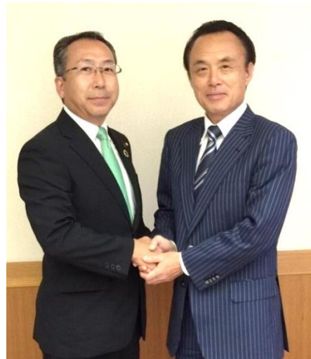
朝霞市長とガッツリ信頼の握手