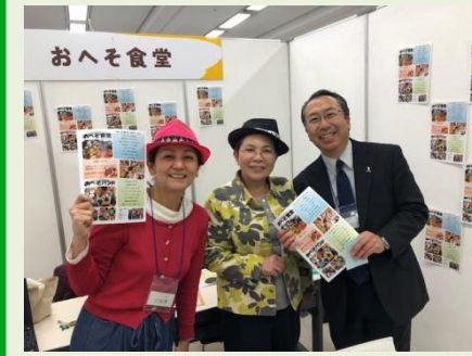
埼玉県子ども食堂フォーラムに参加