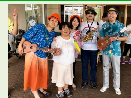
おへそバンド なかよしかふえにて