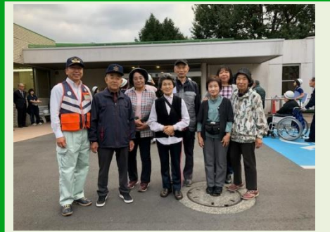
上の原町内会防災訓練（向陽園）