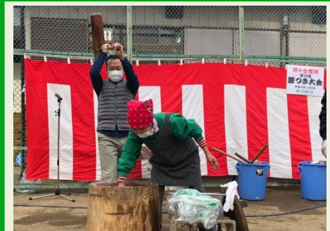
緑ヶ丘親交会 餅つき大会にて