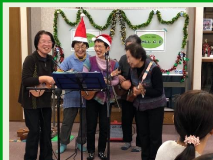
ウクレレサロンまめレレの会にて