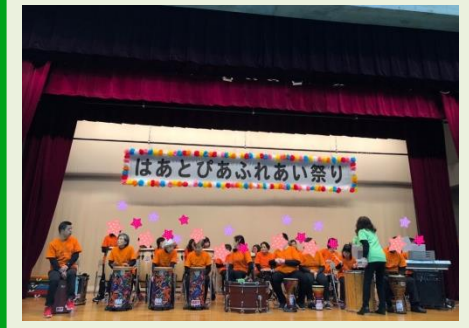
療育音楽を楽しむ会にて