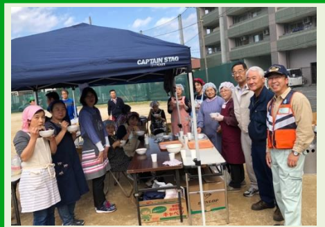
膝折宿町内会防災訓練にて