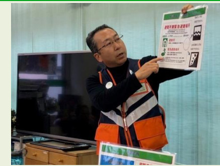
おせっかいな食堂で防災講座