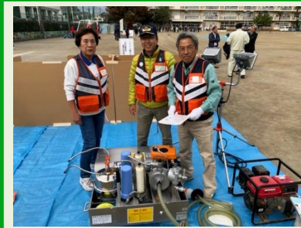
第6小学校区防災訓練