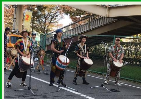
ジャンベ(西アフリカ太鼓)でステージ