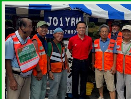
朝霞アマチュア無線クラブにて