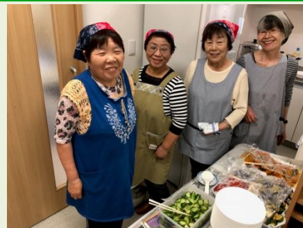
膝折団地ふれあい広場にて