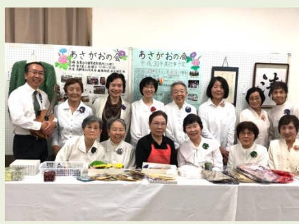
あさがおの会にて