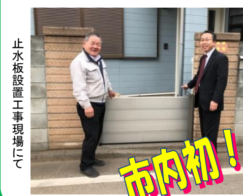
止水板設置工事現場にて

市内初！ 台風や豪雨による浸水被害 を軽減する止水板設置等に 罹災証明書を受けた住宅の 補助金上限引き上げ実現