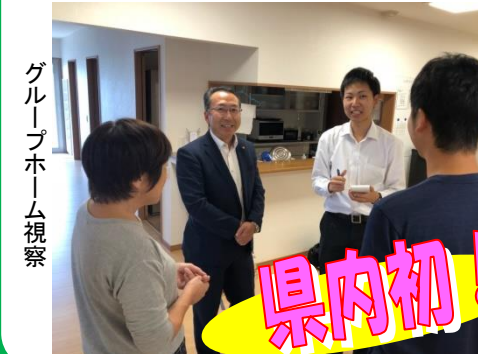
グループホーム視察