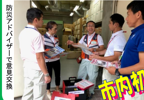
防災アドバイザーで意見交換

避難所運営強化の推進 避難所開設に誰もが躊躇なく関わる事ができる機材 朝霞版を作成中