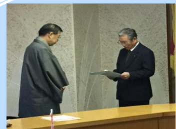
【平成29年1月12日 京都府庁にて】