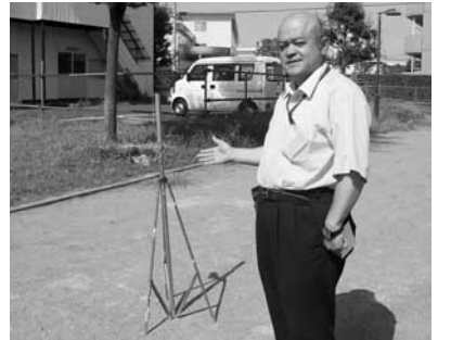
放射線測定一ねんも公園

私たちは日常生活の中で、大気や食物、また宇宙や大地などの自然界から、放射線を絶えず受けながら暮らしています。そして、私たち自身の体内にも放射性物質があり、放射線が出ています。日常生活と放射線の関係について知っておきましょう。