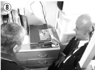
▲音声読書機「よむべい」購入で、いつでも簡単に重要書類や書籍を読めるように。