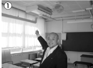
▲都議会公明党が推進・日野市も予算化