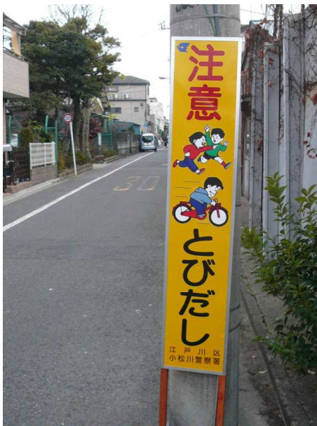
【 松本1丁目18交差点 】