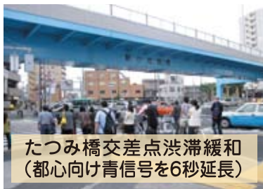
たつみ橋交差点渋滞緩和 (都心向け青信号を6秒延長)