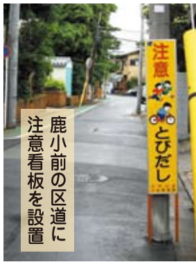
鹿小前の区道に 注意看板を設置