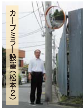
カーブミラー設置(松本2)