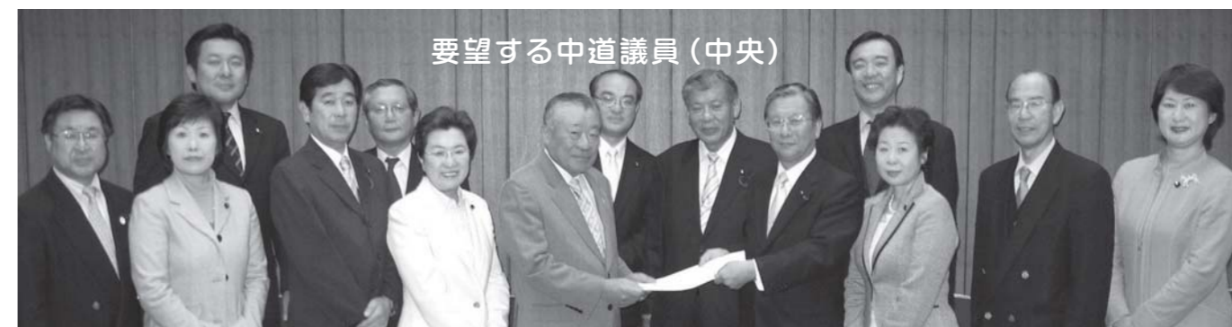
要望する中道議員(中央)

この要望書では、区議会公明党に頂いた区民の皆様や各団体からのご意見を反映させ、特に今春予想される「定額給付金」が区内商品券等へ効果的に活用されるよう求めました。7分野58項目の要望内容は、