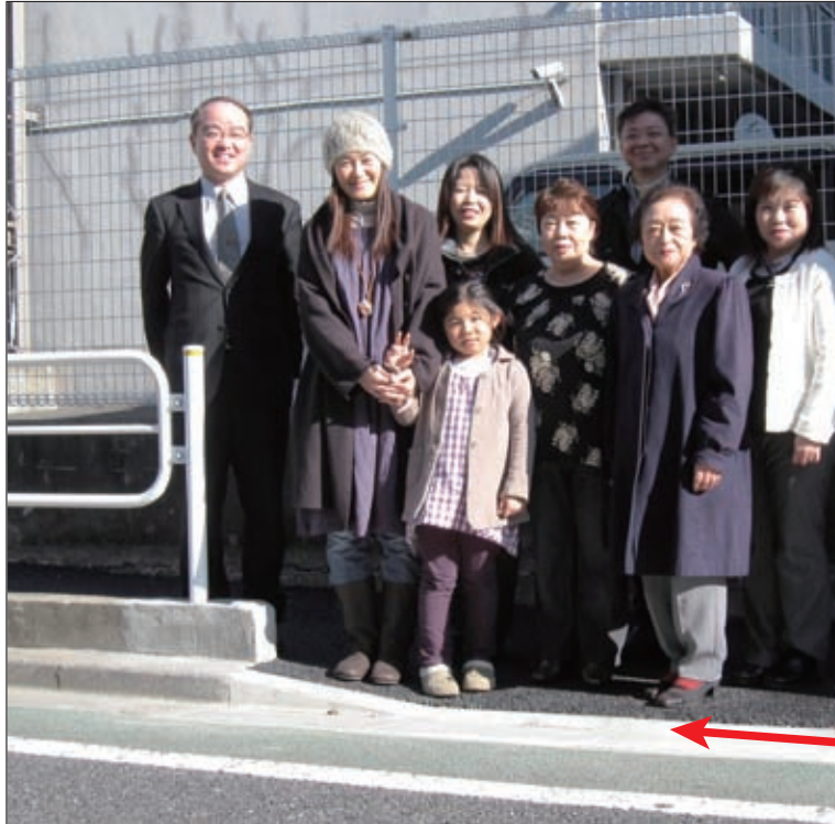
行き止まり歩道を開通 (12/12)

【中央2-17-21】 『変でしょう?』と地元の方から行き止まりの歩道について声を頂きました。大杉小学校への通学路にもなるので安全な歩道にとのご要望でした。