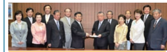
区長に予算要望する区議会公明党【5/11】

●区議会公明党の推進で7月1日よりワケチン接種費用に全額公費助成が実現しました。 全額助成 対象者 24,000円 半額助成 二十歳の女性 12,000円 助成額 3回分 36,000円 助成額 3回分 108,000円 助成額 3回分 324,000円