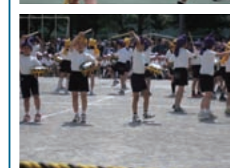
【大杉小学校】 【第三松江小学校】