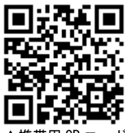
▲携帯用 QR コード

最近、こころの疲れや不調を感じていませんか？日々の生活で無理が続くと、こころのバランスが崩れやすくなります。『こころの体温計』は、気軽にいつでも、どこでも、ストレスや落ち込み度をチェックできるシステムです。ぜひ、こころのケアにお役立てください。