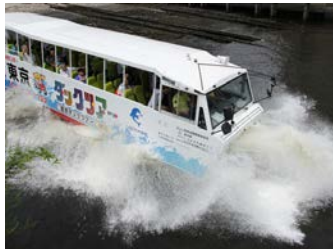
陸からそのまま海へ着水!

都内で水辺を楽しめるレジャーは様々ありますが、水陸両用バスでのクルージングは、なかなか経験がないのではないのでしょうか?ぜひ、この機会に「水陸両用バスツアー」で品川の魅力を再発見してみてください。