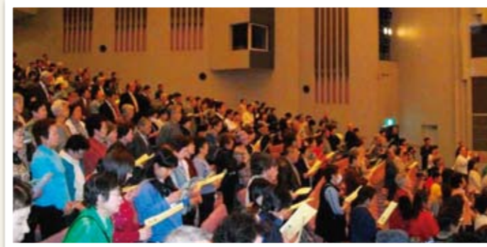
収容人数1000名の会場が観客でいっぱいになりました。

隣家だったため、家がもちあがるほどの衝撃でした。台所で水を飲もうと蛇口を開けた瞬間、ドーンと大きな音がして、家の中で吹き飛ばされました。